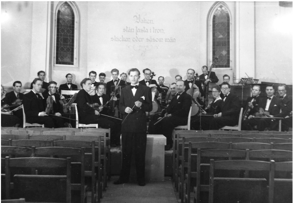
KFUM orkestern stråkorkester

Orkestern grundades 1941 under namnet KFUM symfoniorkestern av Carl Ivan Boström - som en stråkorkester med främst manliga musiker, vilket gällde även för de professionella orkestrarna på den tiden.