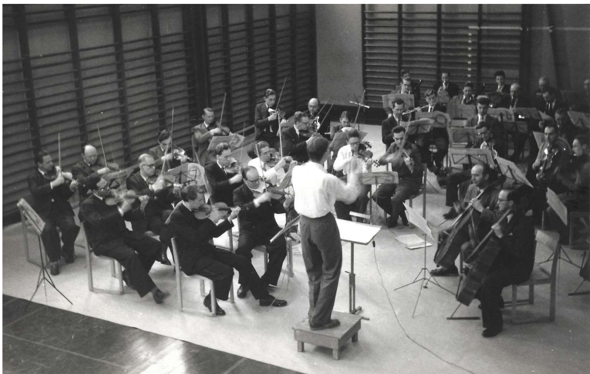
Bild från konsert i Köpenhamn 1955