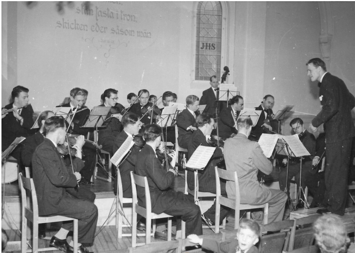
Bild från orkesterns 10-årsjubileum